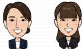
介護福祉士 言語聴覚士

介護施設の裏側まで知る専門相談員が、仕組みや 制度をわかりやすく解説します(裏面参照)