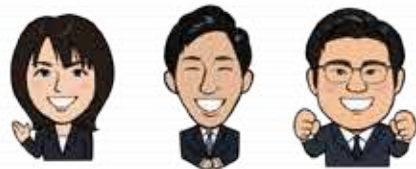
居宅介護支援 専門員 介護福祉士 ホームヘルパー 2級