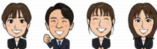
看護師 看護師 看護師 看護師